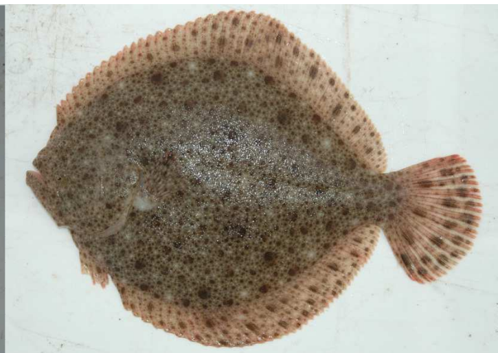
Tarbot met de 'blinde' onderzijde links en de 'ziende' bovenzijde rechts