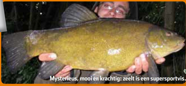
Mysterieus, mooi en krachtig: zeelt is een supersportvis.

Minischubjes, orangerode kraallogjes en een mysterieus goudgroen lijf: zeelt is een schitterende vis om te zien. Daarbij zorgt zijn machtige staartvin voor flink wat power. Maar vis wil iedereen wel vangen. Maar waar en hoe doe je dat?